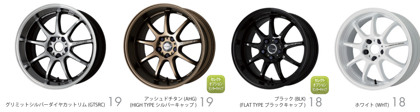
グリミットシルバーダイヤカットリム (GTSRC) 19 アッシュドチタン (AHG) (HIGH TYPE シルバーキャップ) 19 ブラック (BLK) (FLAT TYPE ブラックキャップ) 18 ホワイト (WHT) 18