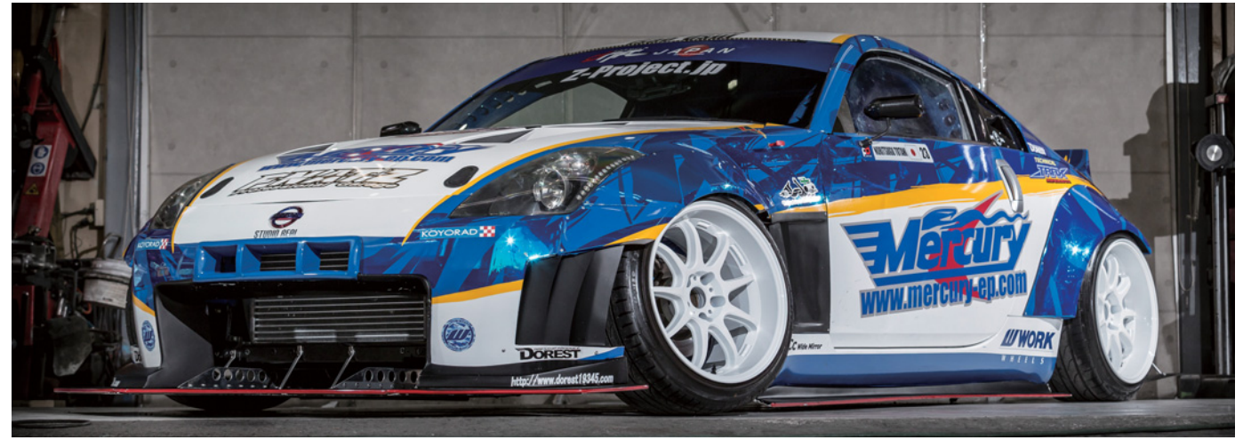
[SIZE] FRONT: 18inch × 10.5J INSET 15mm TIRE: 235/40-18 REAR: 18inch × 10.5J INSET 15mm TIRE: 235/40-18 COLOR: ホワイト (WHT)